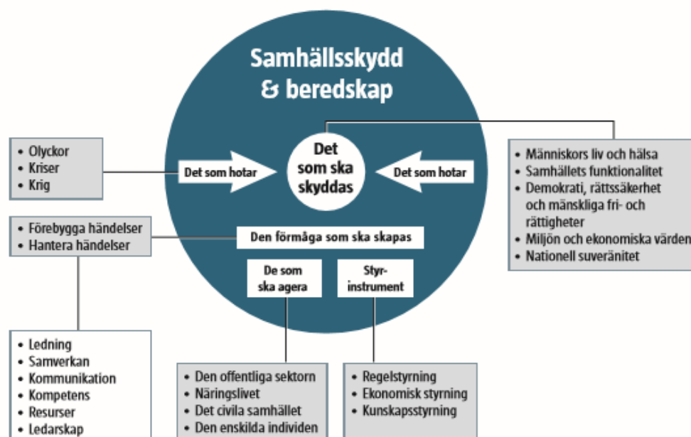
Figur 1MSB modell över samhällsskydd och beredskap.