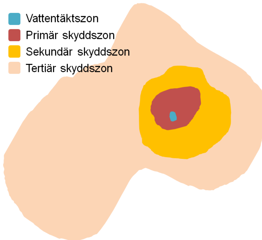
Figur 2 Principskiss över zonindelning av skyddsområde för grundvattentäkt.